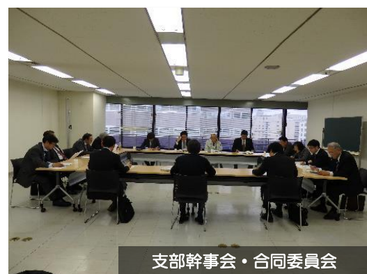
支部幹事会・合同委員会