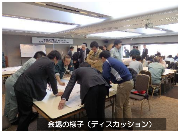
会場の様子（ディスカッション）