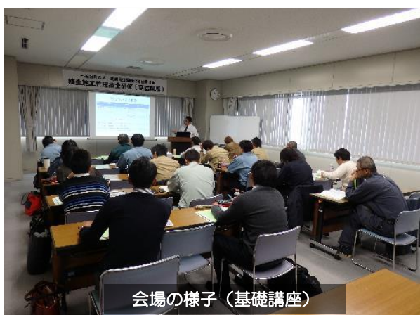
会場の様子（基礎講座）