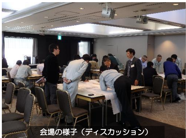
会場の様子（ディスカッション）