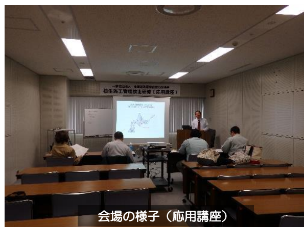
会場の様子（応用講座）