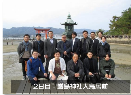
2日目：厳島神社大鳥居前