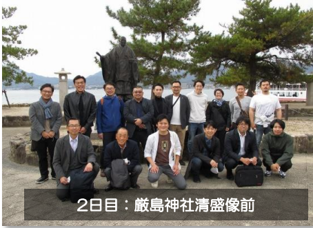
2日目：厳島神社清盛像前