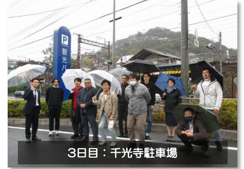
3日目：千光寺駐車場