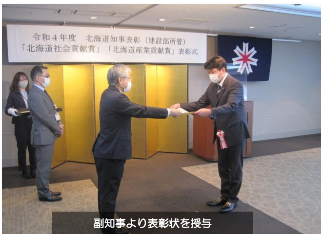
副知事より表彰状を授与

平成9年から建設業に従事し、人材育成事業や造園学会と連携したシンポジウムを開催するなど積極的に活動しており、造園建設業の発展のために尽力してきた。また、関係団体の役員として、永年、業界の発展に貢献をした。