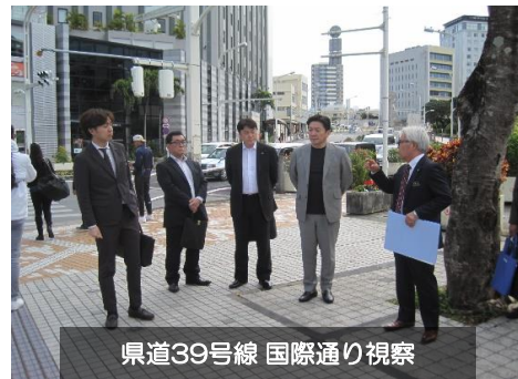
県道39号線 国際通り視察