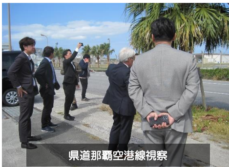
県道那覇空港線視察