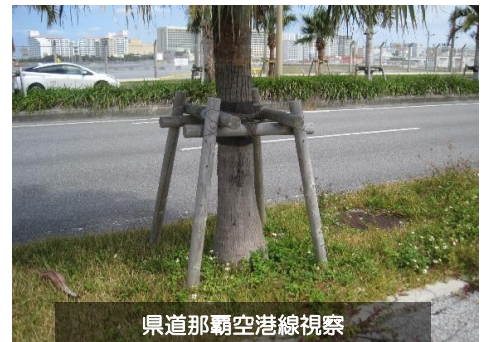
県道那覇空港線視察