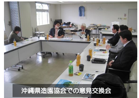
沖縄県造園協会での意見交換会