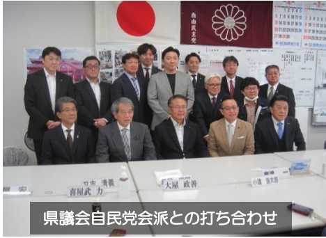
県議会自民党派との打ち合わせ