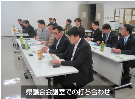
県議会会議室での打ち合わせ