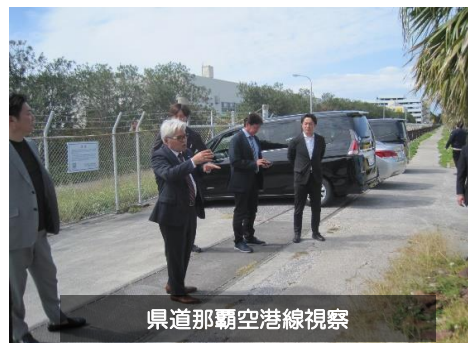
県道那覇空港線視察