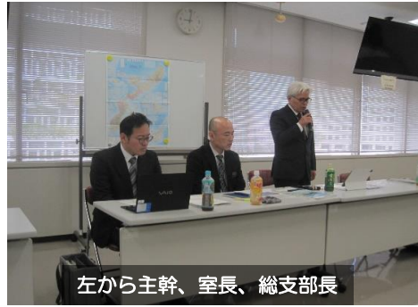
左から主幹、室長、総支部長