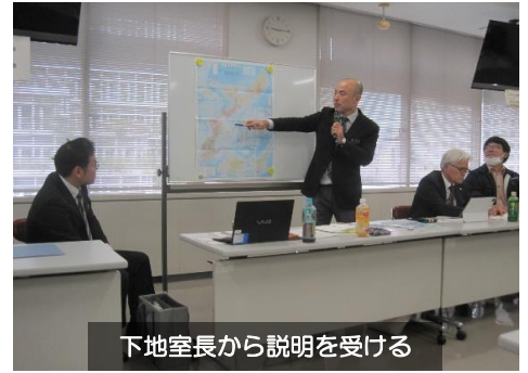
下地室長から説明を受ける