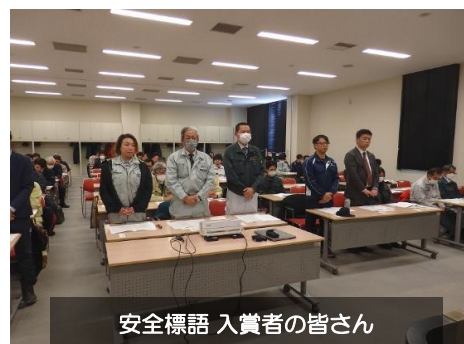
安全標語 入賞者の皆さん