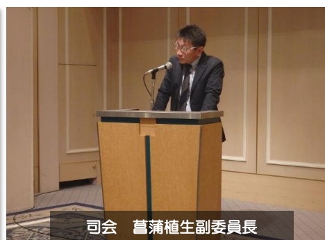
司会 菅蒲植生副委員長