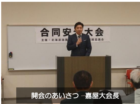
開会のあいさつ 嘉屋大会長