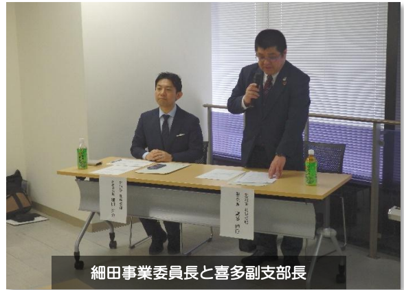
細田事業委員長と喜多副支部長