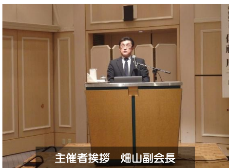
主催者挨拶 畑山副会長