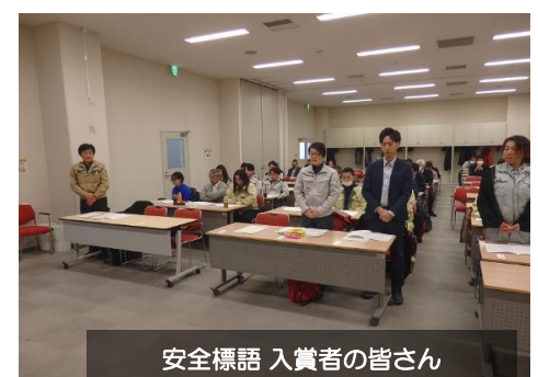
安全標語 入賞者の皆さん