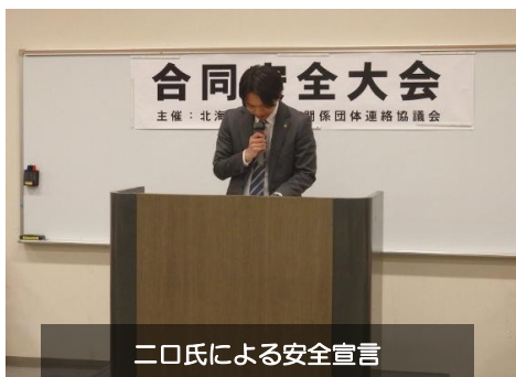
二口氏による安全宣言