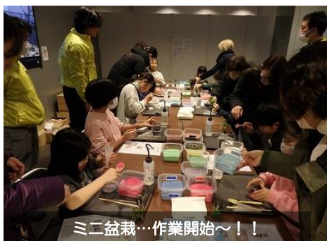
ミニ盆栽…作業開始～！！