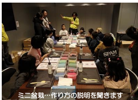
ミニ盆栽…作り方の説明を聞きます

「チカホ」の大通駅側（北洋銀行前）という場所柄、終始人通りが途切れず賑わっていました。大型ビジョンに北造協作製のDVD『緑を守るプロになる！』も放映し、造園建設業の魅力や仕事内容を、多くの人たちにPRすることができました。