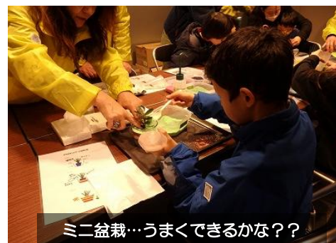
ミニ盆栽…うまくできるかな？