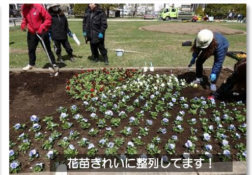
花苗きれいに整列してます！