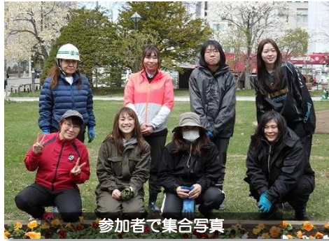
参加者で集合写真