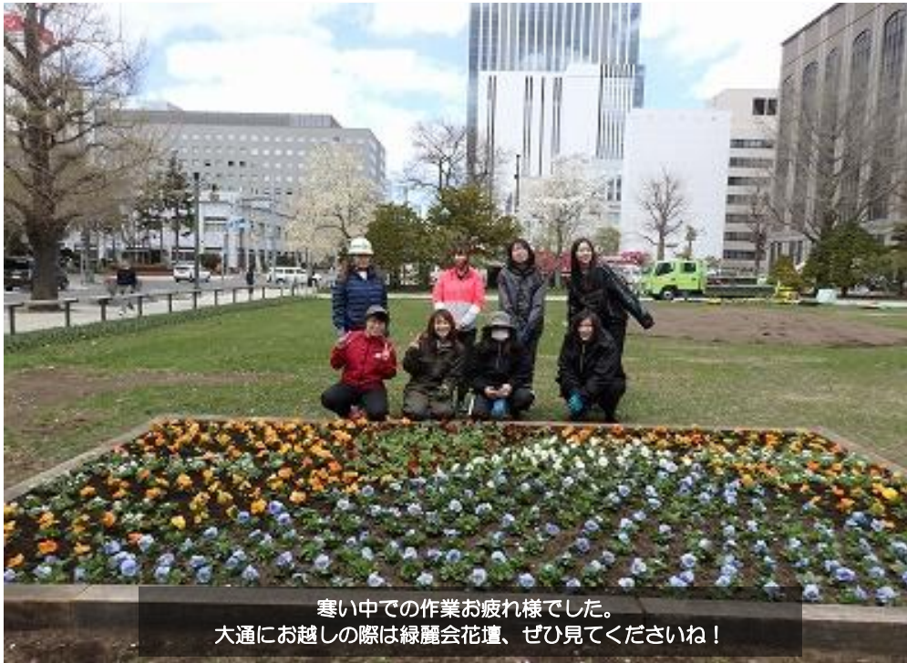
寒い中での作業お疲れ様でした。 大通にお越しの際は緑麗会花壇、ぜひ見てくださいね！