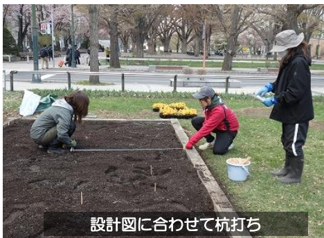
設計図に合わせて杭打ち