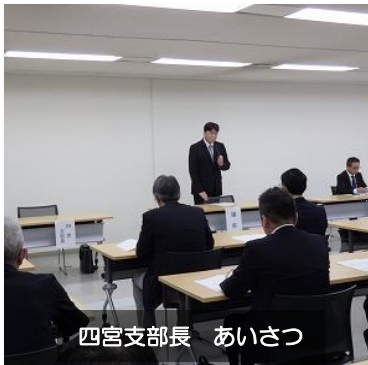
四宮支部長 あいさつ